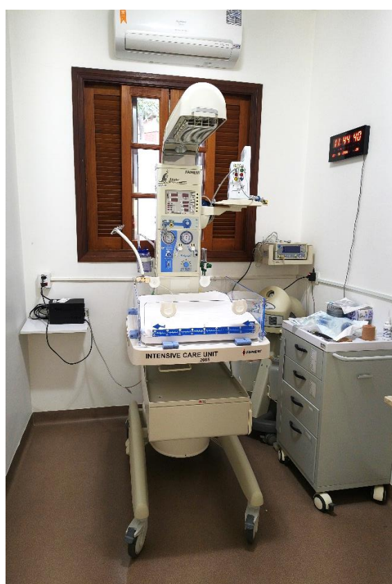
Berço aquecido adquirido (com babypuff)