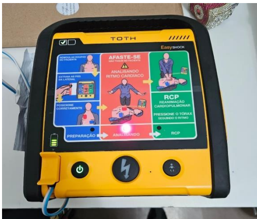
Desfibrilador automático adquirido