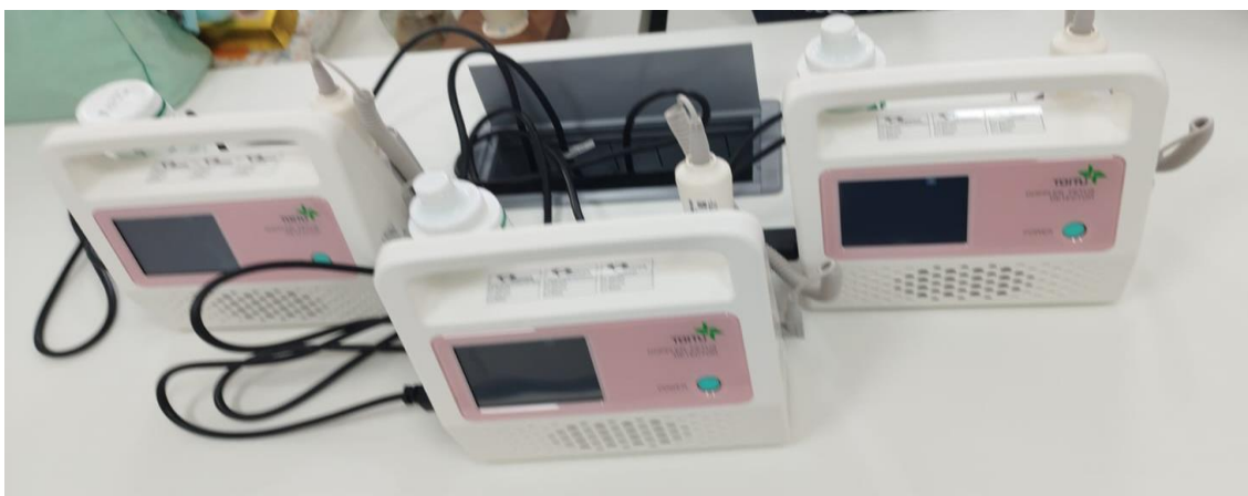
Detectores Fetais adquiridos (6 unidades)