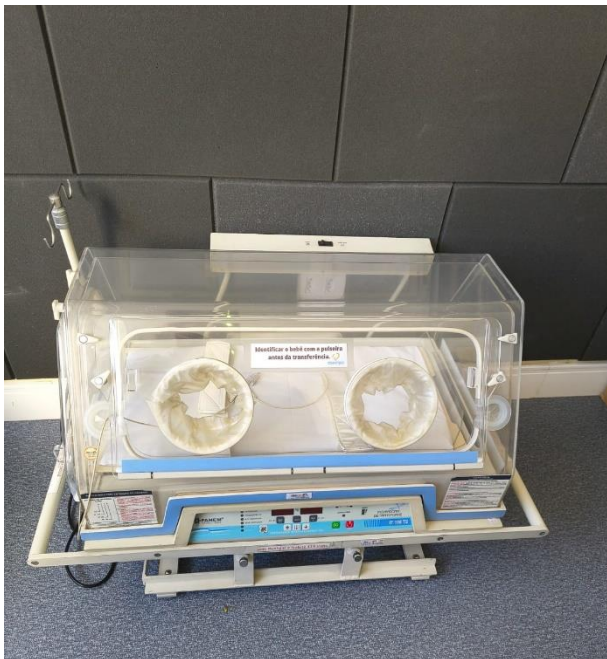
Incubadora de transporte antiga (16 anos de uso)