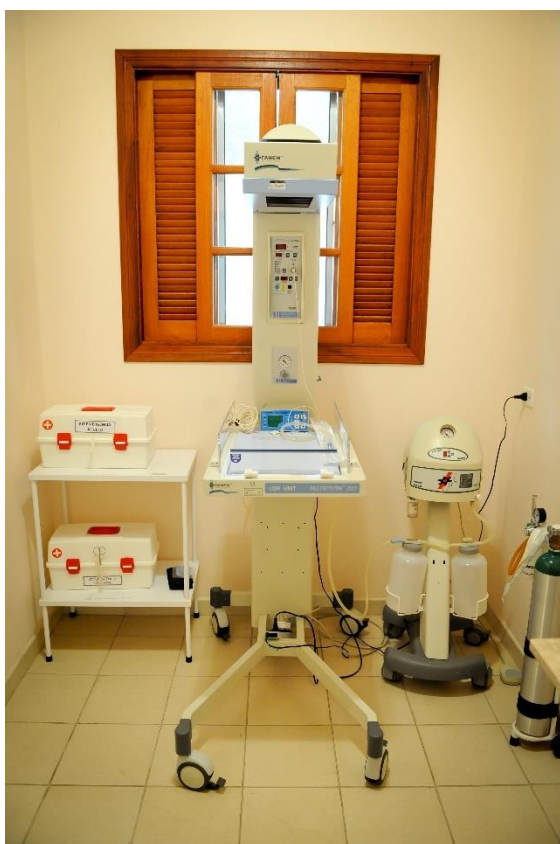
Berço aquecido antigo (16 anos de uso)