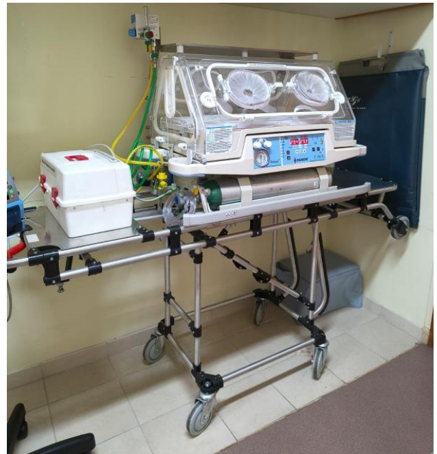
Incubadora de Transporte adquirida, com Babypuff